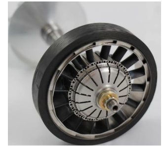
Turbine renversée avec pales en céramique

La startup Exonetik Turbo et le groupe d'innovation Createk développent une nouvelle configuration de turbine renversée capable de supporter des pales en céramique dans un anneau de composite. Avec ses pales en céramique, la turbine renversée permet d'augmenter la température de combustion de 300°C et ainsi réduire la consommation de carburant de 25-30% comparativement aux turbines à gaz actuelles. Combinée à un carburant propre comme l'hydrogène, la turbine renversée rend possible de nouvelles applications révolutionnaires, comme les taxis volants hybrides, tout en réduisant l'empreinte écologique. L'équipe du projet a atteint un jalon important récemment en montrant le fonctionnement de la technologie dans un moteur complet pendant 100h . L'objectif est maintenant de poursuivre la maturation de la technologie en démontrant une bonne durabilité et l'excellente efficacité de conversion. Un aspect essentiel vers l'atteinte de la durée de vie visée est de régler le problème de fluage des ressorts qui maintiennent le contact entre les pales et le moyeu.